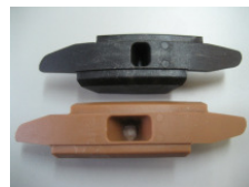
WV-Nr. 1-7 Kunststoff