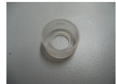
WV-Nr. 1-24 Kunststoffdeckel