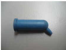
WV-Nr. 1-17 Gummiteil mit Düse