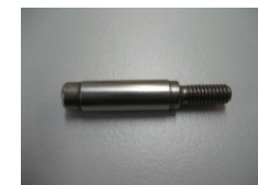
WV-Nr. 1-32 Gewindebolzen (Stahl)