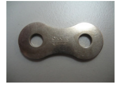
WV-Nr. 1-12 Kettenschloss