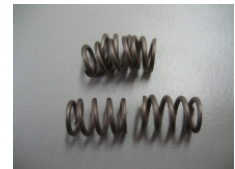
WV-Nr. 1-20 Feder