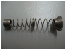
WV-Nr. 1-21 Sonderfeder