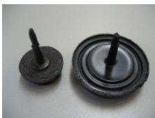
WV-Nr. 1-5 Gummi / Kautschuk