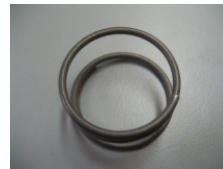
WV-Nr. 1-19 Feder