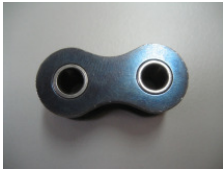
WV-Nr. 1-9 Kettenglied