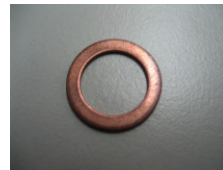
WV-Nr. 1-23 Dichtscheibe