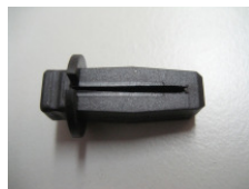
WV-Nr. 1-26 Sicherung (Kunststoff)