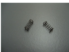
WV-Nr. 1-29 Miniaturfeder