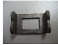
WV-Nr. 1-11 Blechbiegeteil