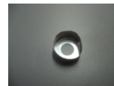
WV-Nr. 1-31 Hülse (Tiefziehteil)