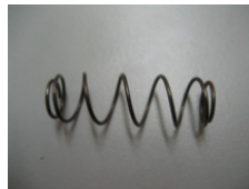
WV-Nr. 1-22 Sonderfeder