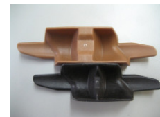
WV-Nr. 1-8 Kunststoff