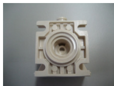
WV-Nr. 1-2 Kunststoff