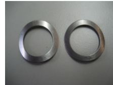
WV-Nr. 1-15 Tellerfeder