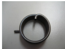
WV-Nr. 1-18 Feder mit Haken