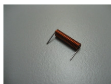
WV-Nr. 1-30 Miniaturfeder