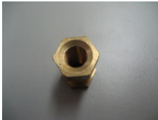
WV-Nr. 1-13 Messing-Buchse