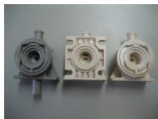
WV-Nr. 1-6 Kunststoff