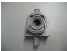
WV-Nr. 1-1 Kunststoff