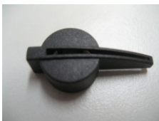
WV-Nr. 1-25 Drehknopf (Kunststoff)