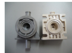
WV-Nr. 1-4 Kunststoff