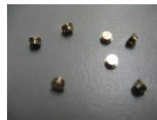
WV-Nr. 1-27 Miniaturschraube