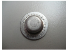
WV-Nr. 1-10 Blechdeckel