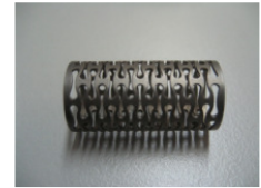
WV-Nr. 1-16 Sonderfeder