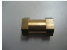
WV-Nr. 1-14 Messingbuchse